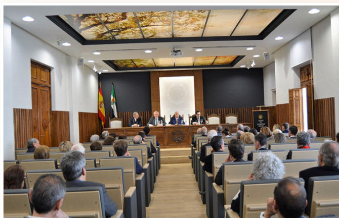
La Sesión Solemne se celebró en el salón de actos del Colegio de Badajoz. 05/04/2018